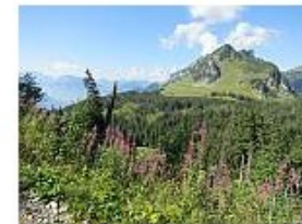
Mattstock, Blick von der Alp Furgglen